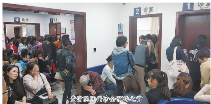
黄浦院区门诊全预约之前