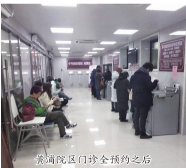
黄浦院区门诊全预约之后